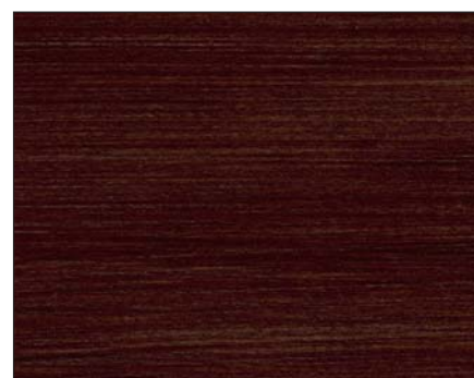
mosca ■ mocha ■ мокка Art.-No. 2306