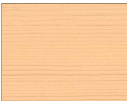
birke ■ birch ■ береза Art.-No. 2303