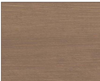
toskanagrau ■ tuscan grey ■ тосканский серый Art.-No. 2308