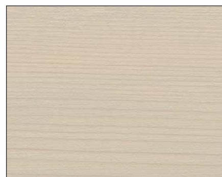
antikgrau ■ antique grey ■ античный серый Art.-No. 2302