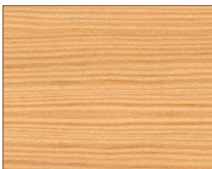
farblos* ■ clear* ■ бесцветный* Art.-No. 2400