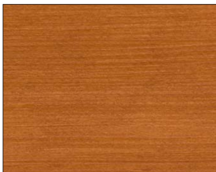
kirsche ■ cherry ■ вишня Art.-No. 2307