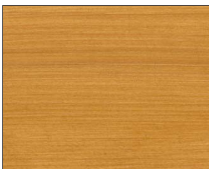
eiche ■ oak ■ дуб Art.-No. 2305